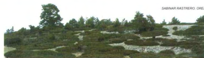
SABINAR RASTRERO. OREA