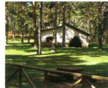
ÁREA RECREATIVA FUENTE DE LOS VAQUEROS. CHECA

Cualquier época es buena para visitar el Parque, pero hay que recordar que durante el invierno se alcanzan muy bajas temperaturas por lo que conviene ir correctamente equipado , especialmente si se va a realizar acampada.