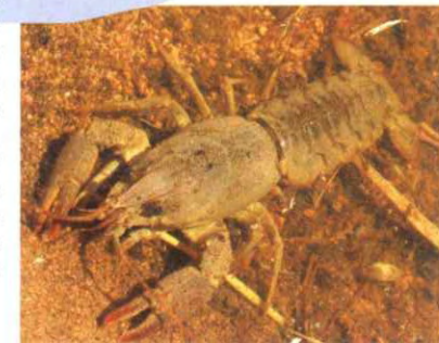
CANGREJO DE RÍO

Los cursos fluviales que surcan el Parque, caracterizados por la excelente calidad de sus aguas y el buen estado de conservación de sus riberas y fondos, propician la presencia de una de las mejores poblaciones de nutria de la región, además de albergar truchas, bogas y barbos, entre otras especies acuáticas. Por último, en algunos de los más recónditos cursos de agua, todavía podemos encontrar algunas de las últimas poblaciones de cangrejo de río, especie en fuerte regresión a nivel regional y nacional.