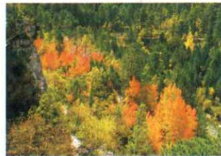
BOSQUE DE RIBERA. TARAVILLA

En cuanto a la vegetación son relevantes los extensos pinares de diferentes especies, existiendo grandes masas de pinos silvestre, laricio y resinero, además de superficies más reducidas, pero no menos valiosas, de pino carrasco. Estos pinares ocupan principalmente las cuevas de los valles fluviales y zonas de mayor altitud. Vegetando bajo la cubierta de los pinares o formando masas puras encontramos quejigos, encinas y melojos. En la zona central del Parque, en las parameras calizas, se sitúan las vastas formaciones de sabinas albar que presentan en esta zona algunas de sus masas mejor conservadas de Europa.