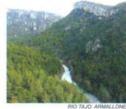
RIO TAJO. ARMALLONES

El Parque Natural del Alto Tajo se caracteriza por la gran diversidad florística que atesora, ya que dentro de sus límites vegetan cerca de un 20% del total de especies presentes en la flora ibérica. Esta enorme variedad es debida a dos circunstancias: por un lado la compleja red de cañones, hoces, parameras y valles fluviales, que abarca desde los 700 a los 1890 m de altitud en distintos tipos de suelos, lo que origina un gran variedad de nichos ecológicos; por otro la estratégica posición biogeográfica del Parque, situado a caballo entre el Sistema Ibérico y las estribaciones del Sistema Central. Estos dos hechos convierten al Alto Tajo en una encrucijada florística, en la que tienen cabida tanto especies típicamente pirenaicas, como de los sistemas béticos o incluso de las Sierras de Levante.