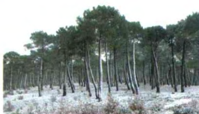
INVIERNO EN PINAR DE PINO RODENO EN CORDUENTE

Toda esta superficie está incluida en la propuesta de Lugares que integrarán la Red NATURA 2000 como Lugar de Interés Comunitario (LIC) y Zona de Especial Protección para las Aves (ZEPA).